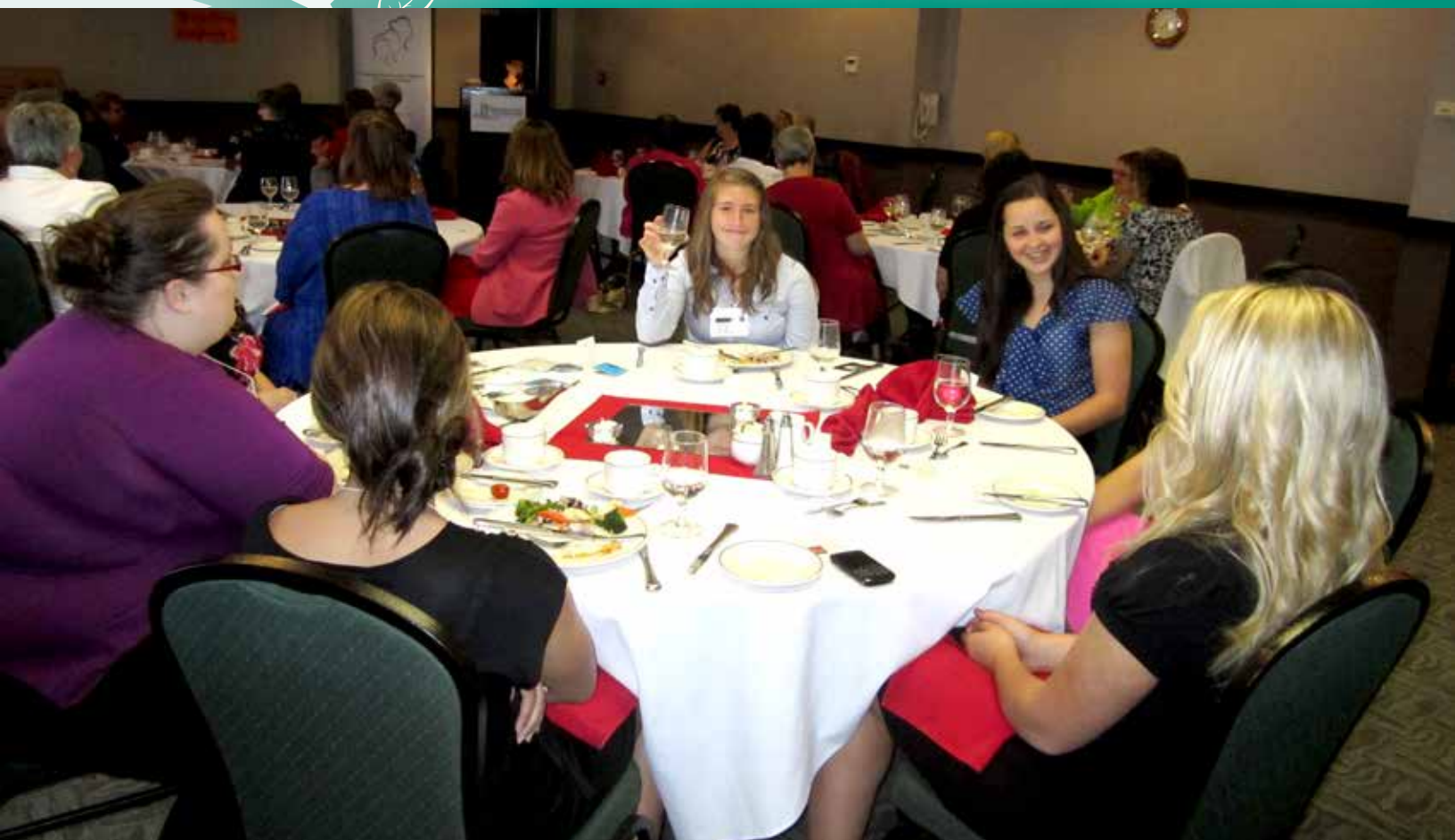
Délégation jeunes femmes Richmond 2012

À l'été 2012, le conseil d'administration du conseil jeunesse provincial a été à Hamains Plains faire du camping, suivre des formations de « team building » et bien sûr, a travaillé très fort pendant leurs réunions. Cette fin de semaine fut une manière d'initier les nouveaux membres du C.A.