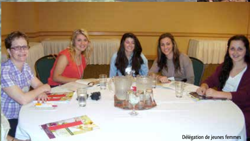
Délégation de jeunes femmes