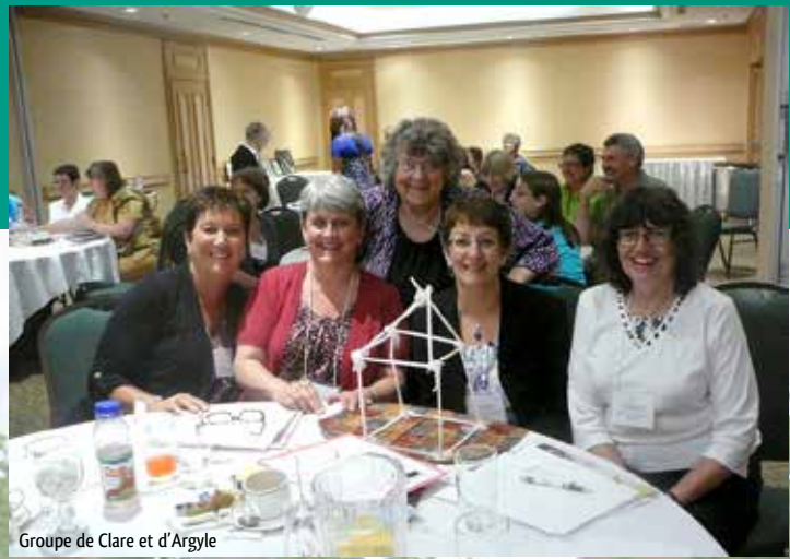
Groupe de Clare et d'Argyle