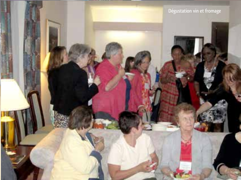
Dégustation vin et fromage