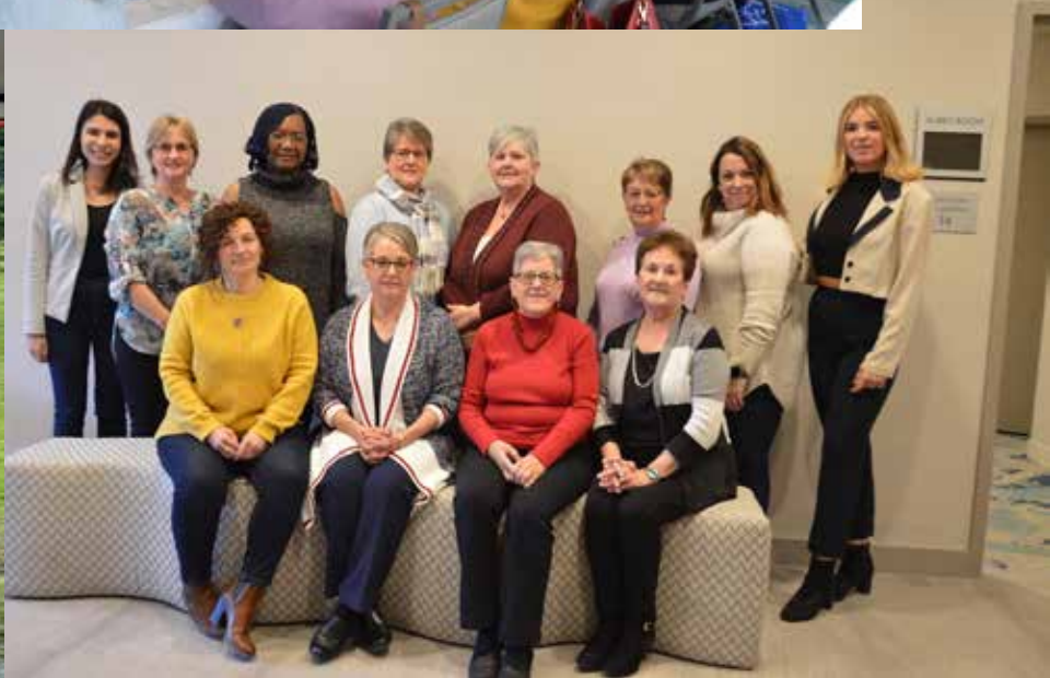
Conseil d'administration et équipe 2019-2020