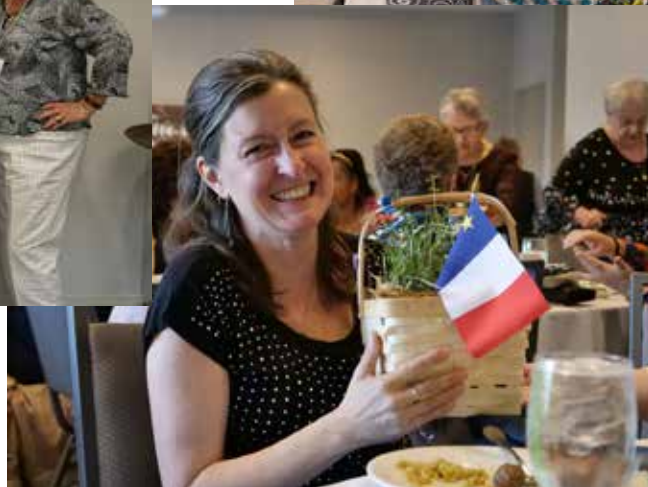
AGA – Mai 2019