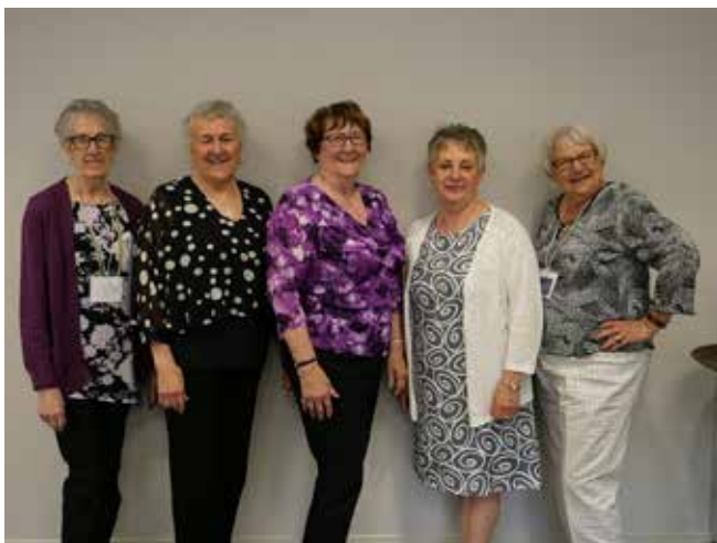
AGA – Mai 2019