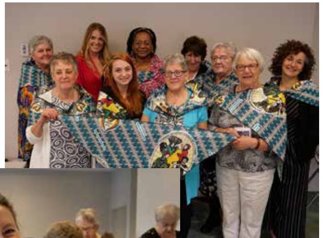
AGA – Mai 2019