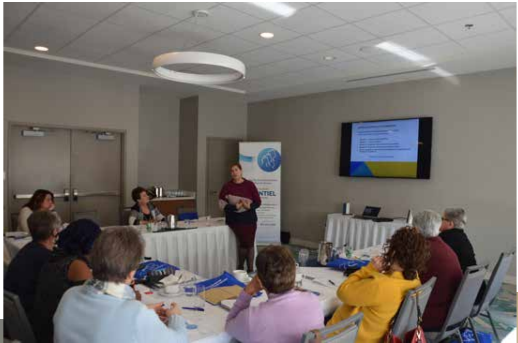
Formation avec la FANE Février 2020