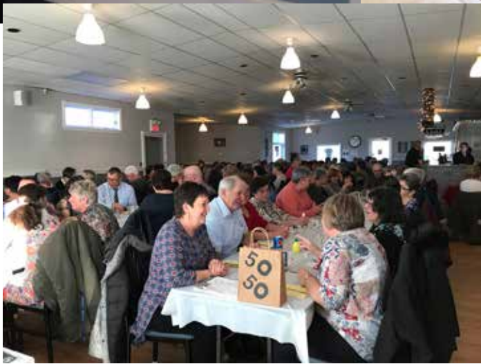
Lancement du livre des femmes inspirantes – Avril 2019