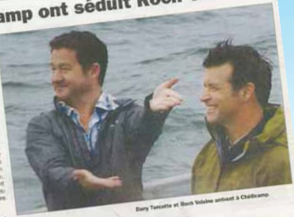
Dany Turcotte et Roch Voisine arrivent à Chéticamp.

C'est le dimanche matin que Roch Voisine et Dany Turcotte, l'animateur de l'émission La petite séduction sont arrivés par bateau au Quai du Gouvernement à Chéticamp. Plusieurs centaines de personnes, munies de drapeaux acadiens et d'instruments pour faire du bruit, étaient rassemblées pour les accueillir. Une dizaine de femmes portait le nom Hélène (l'art s'appelle). M me Voisine et Turcotte sont montés dans un rickshaw (ou pouasse-pouasse) pour se rendre à leur prochaine activité.