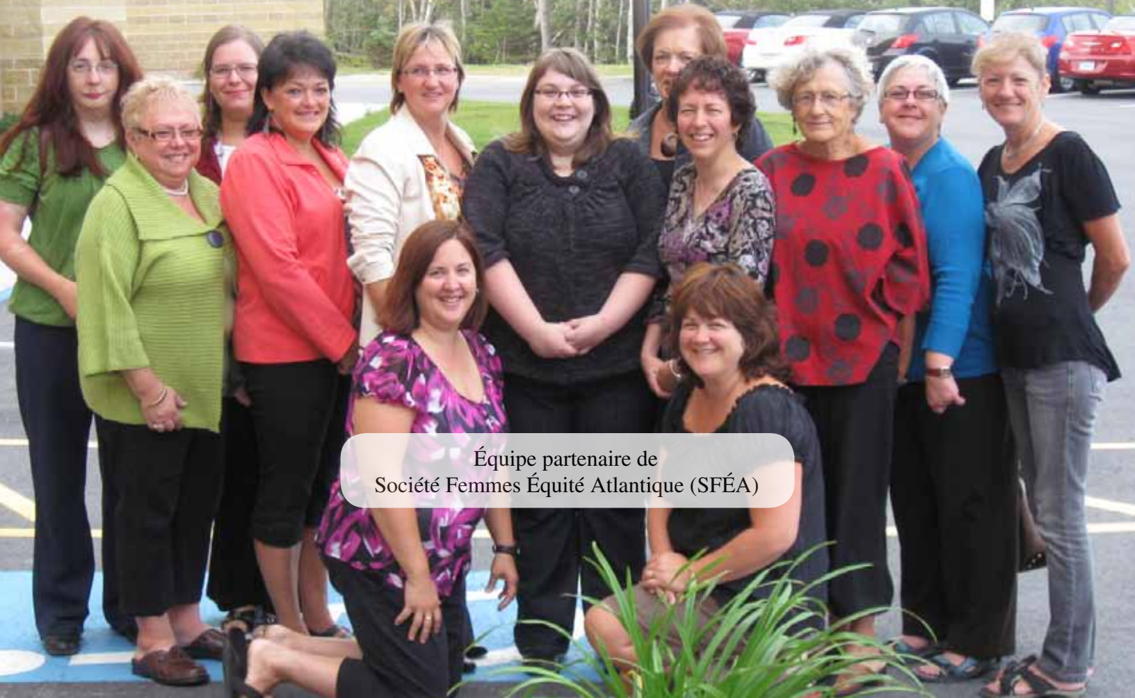
Équipe partenaire de Société Femmes Équité Atlantique (SFÉA)

Condition féminine Canada Status of Women Canada