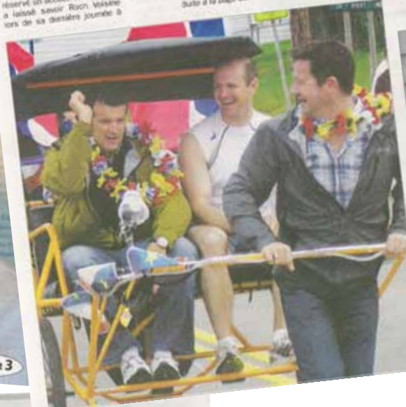
Suite à la page 13.