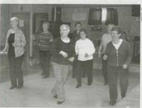
Les femmes ont apprécié les différentes activités telles que la Marche de la femme.

CHÉTICAMP : Le 8 mars 2011, une centaine de femmes se sont regroupées pour célébrer la Journée internationale de la femme.